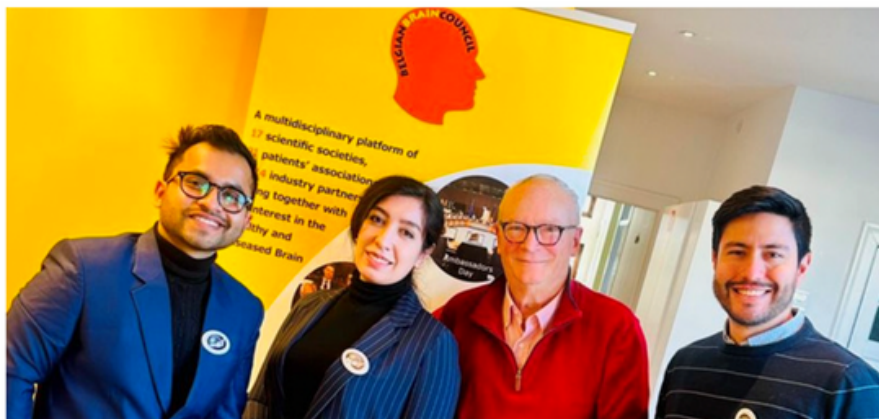
The trainees from the EU4EU program began their training in March and are currently engaged in activities organized by the BBC

BBC acts as a host organization for the EU4EU Programme within its Erasmus+ projects