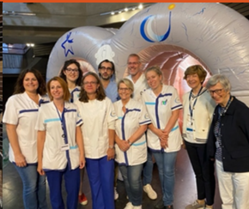
Chirec-team in Eigenbrakel