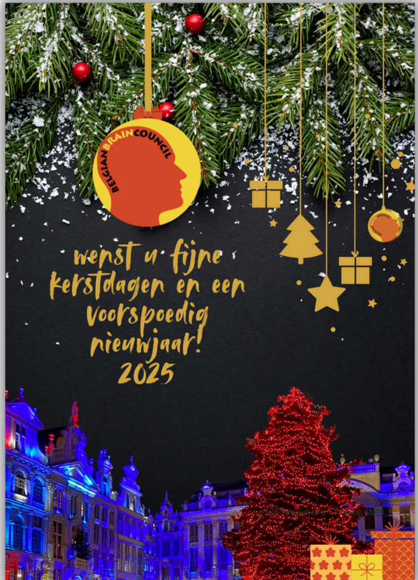
Foto: Grote Markt van Brussel december 2024

We zullen blijven werken en samenwerken aan onderzoek en goede praktijken die de geestelijke en hersengezondheid bevorderen.