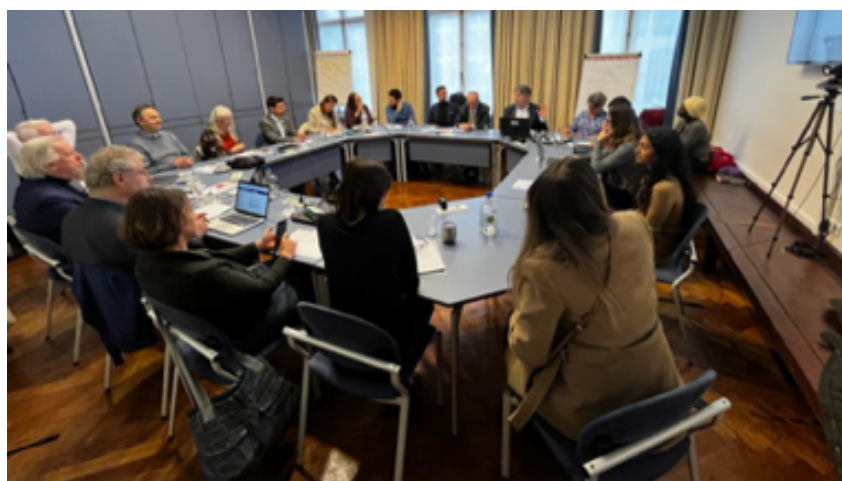
Belgisch Hersenplan - Reünie van de 17e maart